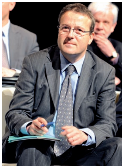
MARTIN HIRSCH, haut-commissaire à la Jeunesse , a écouté attentivement les interventions des délégués des apprentis.