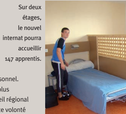
Sur deux étages, le nouvel internat pourra accueillir 147 apprentis.