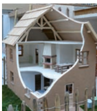
Maison écologique, réalisée par des apprentis.

Le CFA-BTP de Limoges a remporté une mention spéciale Réalisation lors du challenge Découvrir les métiers du plâtre 2009 organisé à l'initiative de l'Association pour la promotion des métiers du plâtre. Ce sont trois maquettes entièrement en plâtre (une maison écologique, une tour du développement durable