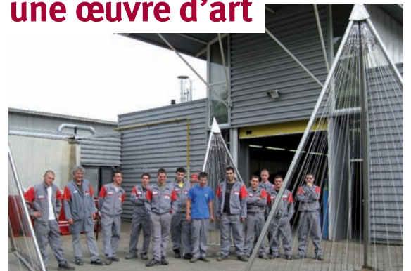
Une des pyramides qui ornent un rond-point de Bourgoin-Jallieu.

C'est à la réalisation d'une véritable œuvre d'art qu'ont participé les vingt-huit apprentis de deuxième année en métallerie et mention soudeur du CFA-BTP de Bourgoin-Jallieu. La mairie a fait appel à leur savoir-faire pour assembler les pièces en inox de trois grandes pyramides de 3, 4 et 5 mètres de haut dessinées par l'architecte et le responsable des espaces verts de la ville. Composées d'une base triangulaire et de câbles en inox, prévus pour soutenir une végétation grimpante, ces imposantes structures sont exposées au centre d'un rond-point de la ville. Une bonne expérience pour ces jeunes, dont la formation de haut niveau est ici reconnue et valorisée.