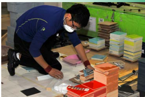
<< Candidat coréen en carrelage.

Un peu plus loin, le compétiteur indonésien semble un peu perdu pour finaliser la découpe des courbes qu'il doit encore entreprendre. Il se tourne et se retourne, cherchant un outil qu'il ne trouve visiblement pas.