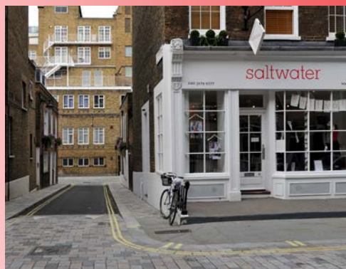
<< Une rue de Londres.