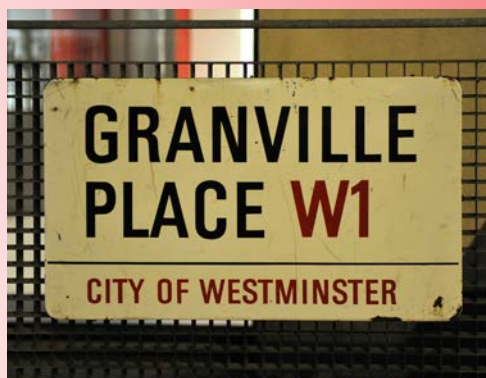
<< Une plaque de rue.