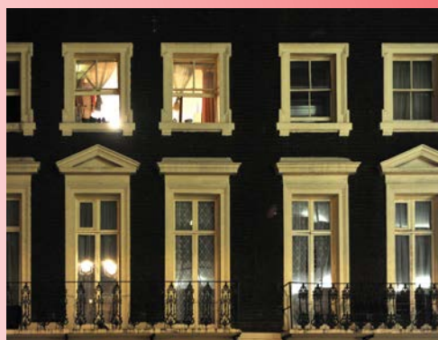
<< Londres la nuit.