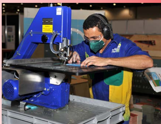
<< Compétiteur brésilien en carrelage.