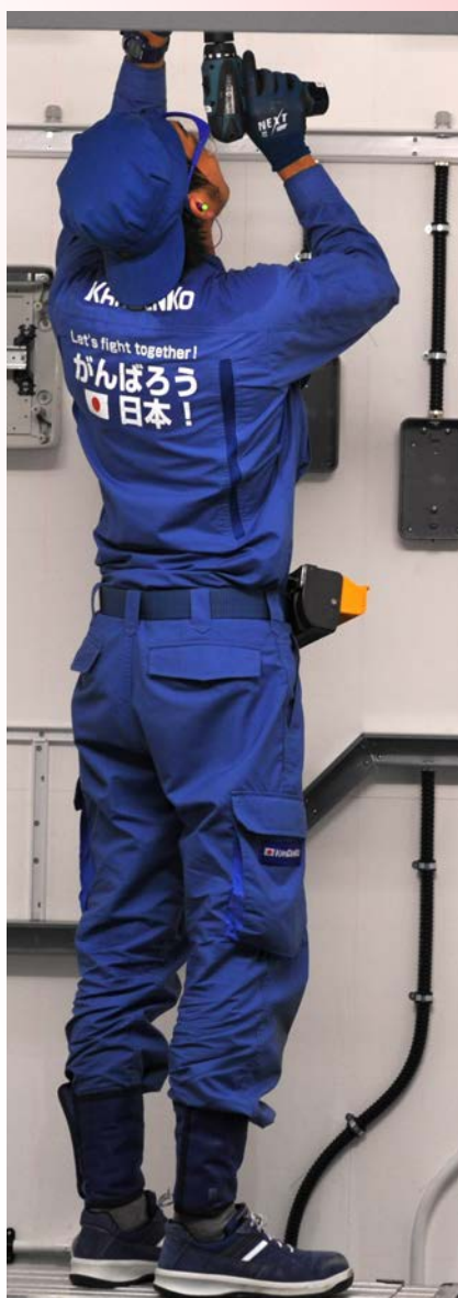
<< Compétiteur japonais en installations électriques.