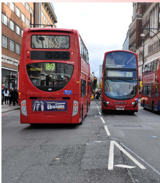
<< Les bus à impériale.