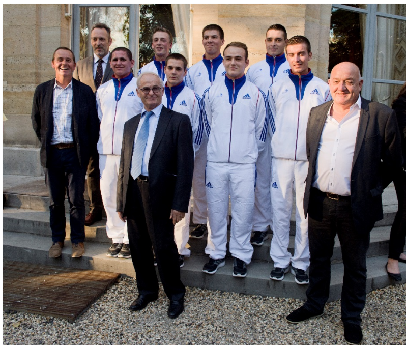
De gauche à droite

Les métiers du bâtiment et des travaux publics constituent l'un des pôles les plus importants en compétition, avec 11 métiers. 7 jeunes sur les 11 candidats qui concourent dans le pôle BTP ont été formés au sein des CFA du réseau de l'apprentissage BTP.