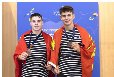
Médaille de bronze