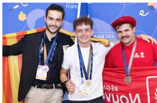
Podium Médailles d'or, d'argent et de bronze