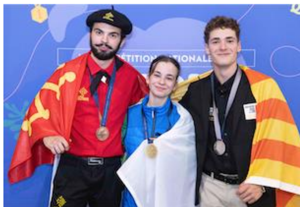
Podium Médailles d'or, d'argent et de bronze