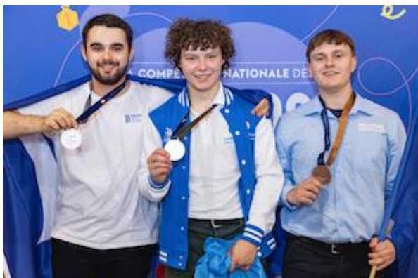
Podium Médailles d'or, d'argent et de bronze