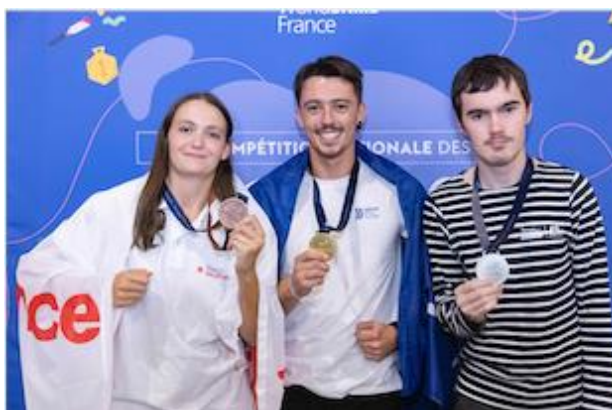
Podium Médailles d'or, d'argent et de bronze